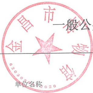
一般公共预算“三公”经费、会议费、培训费支出情况表