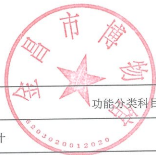
部门支出总体情况表